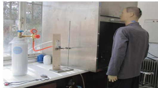
شکل ۱- چیدمان آزمون گاز بی‌اثر براساس روش ASHRAE 110

آزمون گاز بی‌اثر: مهم‌ترین بخش عملی پژوهش، تزریق گاز بی‌اثر در سه گذر حجمی مختلف و اندازه‌گیری میزان مواجهه شغلی یک اپراتور مجازی ایستاده در مقابل هود بود. در کلیه بخش‌های آزمون هود به منظور شبیه‌سازی شرایط واقعی، مطابق با شرایط ذکر شده در استاندارد ASHRAE 110-95 یک مانکن با قد ۱۷۰ سانتی‌متر به گونه‌ای در حد وسط مقابل هود قرار گرفت که بینی آن ۷/۵ سانتی‌متر از پنجره هود فاصله داشته باشد (۶، ۹ و ۱۴) شکل (۲). سپس گاز ردیاب سولفور هگزافلوراید در گذرهای حجمی ۲، ۳ و ۴ لیتر بر دقیقه به هود تزریق و مقدار مواجهه شغلی اپراتور مجازی که در واقع نشان دهنده میزان نشتی گاز ردیاب از هود به شمار می‌رود در مجموع با سه بار تکرار ۲۷ بار با روش قرائت مستقیم اندازه‌گیری شد.