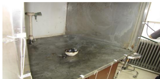
شکل ۲- شکلی از آزمون دود

نتایج آزمون دود: نتایج آزمون دود نشان داد که هود مورد آزمایش در کلیه آزمون‌های دود با حجم زیاد در هر سه سرعت دارای نشتی است زیرا جریان دود به خارج از هود هدایت شده و حتی ممکن است به ناحیه تنفسی اپراتور هود رسیده و منجر به مواجهه وی شود؛ اما در آزمون دود با حجم کم در تمامی سرعت‌ها عملکرد هود قابل پذیرش بود زیرا دود تزریق شده توسط هود به داخل آن کشیده می‌شد. در شکل ۲ تصویری از آزمون انجام شده نشان داده شده است.