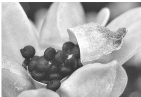
بقلة الحَمَقَاء (خُرْفَه، بقلة المباركة، بقلة الزهراء، بقلة لینه) (Portulaca oleracea : purslane)

شکل ۴- درج تصاویر گیاهان دارویی و ابزارهای پزشکی نیاکان در نسخه الکترونیک