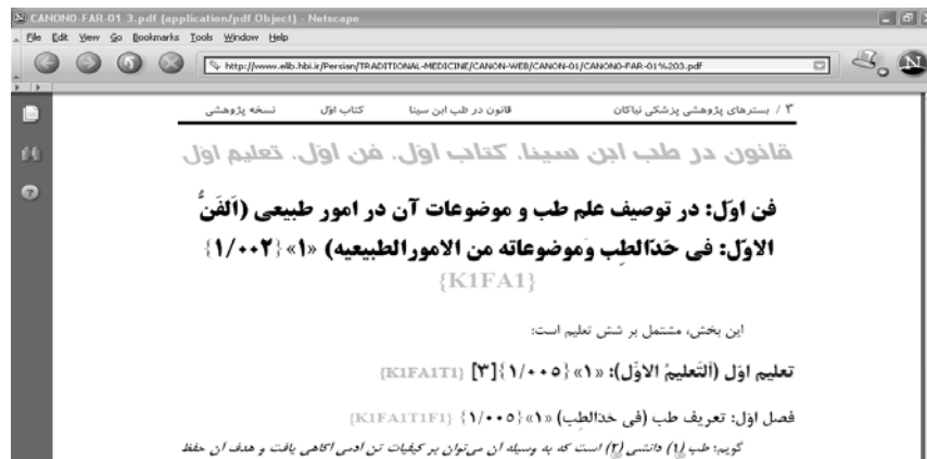
شکل ۵- ورود به منبع مورد نظر با کلیک بر روی کد مورد بحث (سایت اینترنتی وزارت بهداشت)

زیرعنوان مشابهی است که باعث تسهیل ارتباط نسخ مختلف قانون، اعم از انگلیسی، فارسی و عربی می‌گردد و بدینوسیله به آسانی میتوان عناوین و مطالب مندرج در هر نسخه را با نسخه‌های دیگر نیز مقابله و مقایسه کرد. مثلا کد KIFAITIF1 در کلیه نسخه‌ها از راست به چپ به معنی فصل اول از تعلیم اول از فن اول از کتاب اول میباشد که در رفرنس نویسی الکترونیک و پیوند مقالات و کتب الکترونیک به این منابع در سایت وزارت بهداشت، کارایی بسیار زیادی خواهد داشت و علاوه بر آن در صورتیکه رفرنس نویسی مقاله به گونه‌ای باشد که چنین کدی در انتهای یکی از منابع مقاله درج شود کلیک چپ موس بر روی کد مورد اشاره باعث ظاهر شدن منبع مورد استفاده خواهد گردید (شکل ۵).