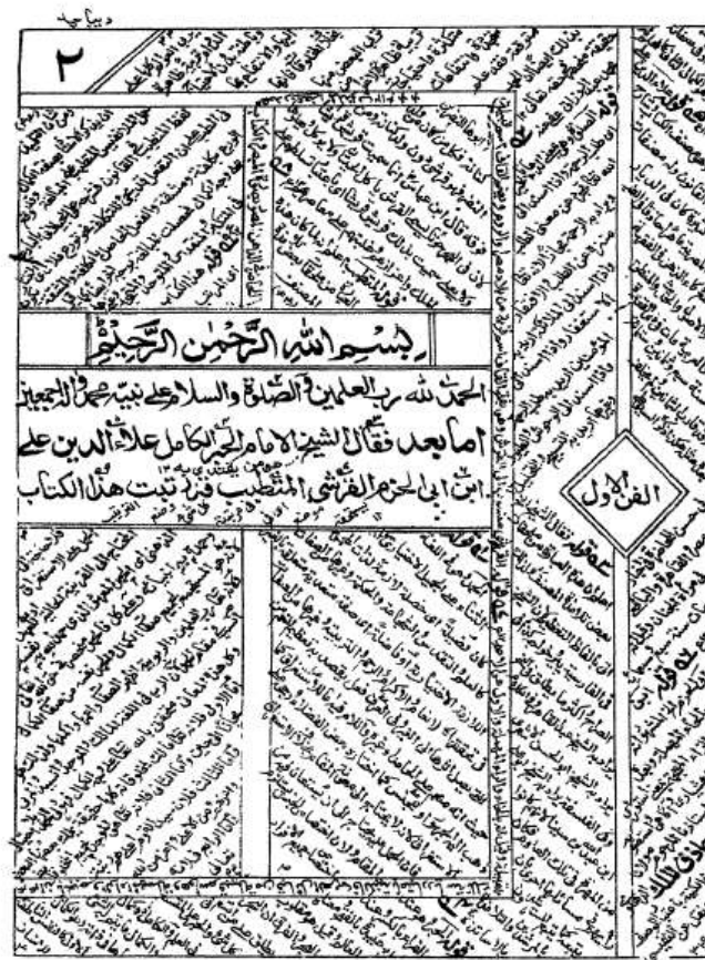
تصویر ۵: چاپ سنگی با عنوان «الموجز المحشى بالتحشية الجديدة»، چاپخانه مجتبیایی دهلی، شامل حواشی حکیم محمد عبدالرزاق