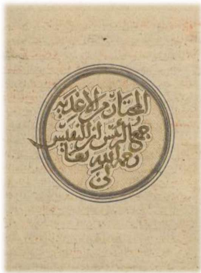
تصویر ۱: دست‌نویس «المختار من الأغذية» به شماره pm۶۴۰۰ ۳۵۳، محفوظ در کتابخانه دولتی برلین (Staatsbibliothek zu Berlin)