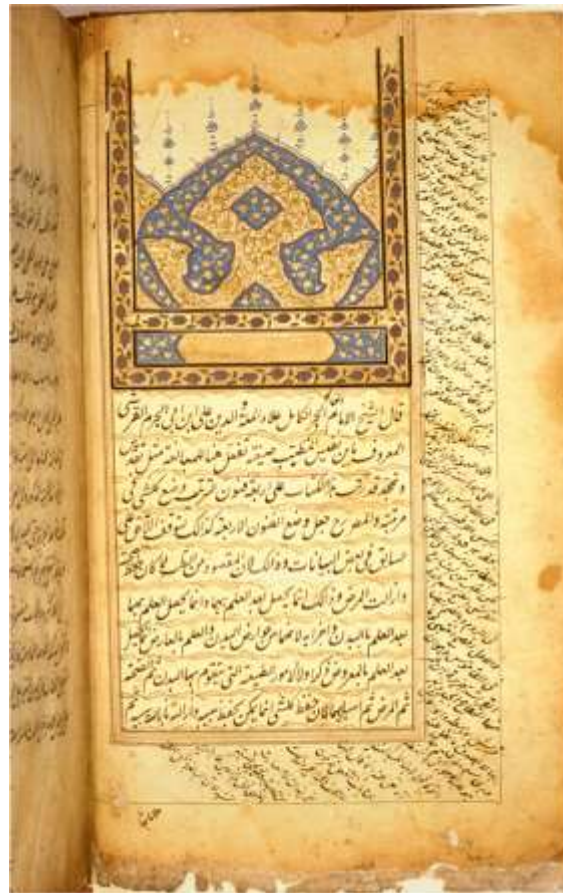
تصویر ۶: در حاشیه این دست‌نویس درباره وجه خوانش قرشی توضیحاتی می‌یابیم.