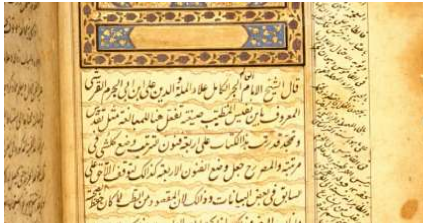
تصویر ۴: به ضبط ابن ابی الجرم در متن و توضیحات حاشیه این نسخه توجه فرمایید.