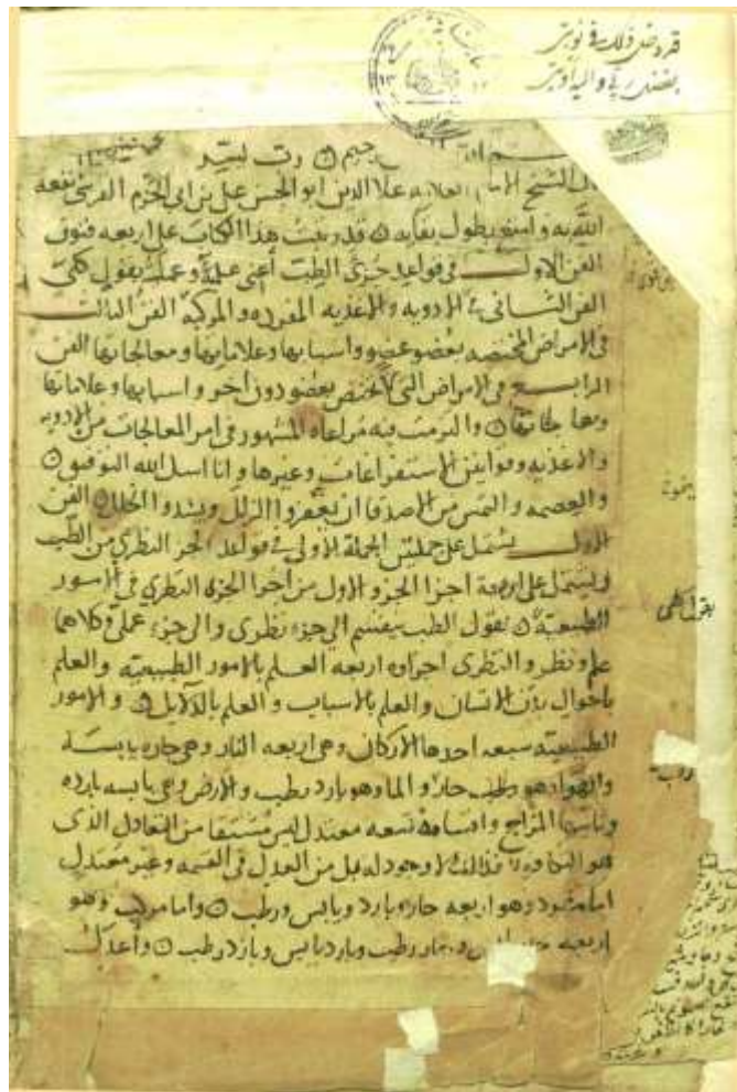
تصویر ۲: دست‌نویس الموجز، زمان حیات قرشی، به سال ۶۸۱، مدرسه کاملیه قاهره، محفوظ در کتابخانه ملی ایران، به شماره ۱۵۱۱ (فهرست‌نگاران به اشتباه تاریخ نگارش نسخه را سده هشتم نقل کرده‌اند (۳۳).