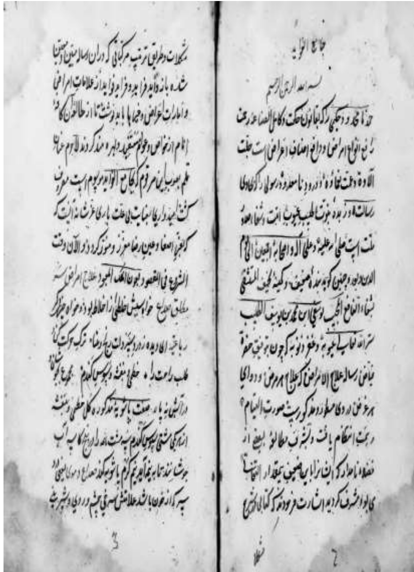
منظومه جامع الفوائد، حکیم هروی، صفحه نخست، نسخه کتابخانه لس آنجلس