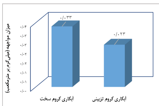
نمودار ۳- میزان مواجهه با کروم VI کارگاه‌های آبکاری کروم سخت و تزئینی

ارزیابی مواجهه با کروم شش ظرفیتی در آبکاران کروم سخت و تزئینی در نمودار شماره ۳ مقایسه شده است. نتایج مطالعه نشان می‌دهد مواجهه با کروم VI در دو گروه از آبکاران اختلاف معنی‌داری دارد ( p \leq 0.0001 ) و میزان مواجهه با کروم شش ظرفیتی در بین آبکاران کروم سخت بالاتر از آبکاران کروم تزئینی است.