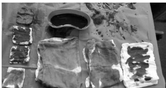
شکل ۱- سناریوی طراحی شده برای تخمین حجم خون موجود بر روی گاز ولنگاز و رسیور.

در بار اول آغشته به ۱۰۰ میلی‌لیتر و در بار دوم آغشته به ۷۰ میلی‌لیتر خون. (شکل ۱ و ۲)