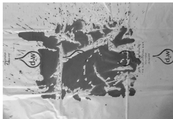
شکل ۲- سناریوی طراحی شده برای تخمین حجم خون موجود بر روی سطح صاف.