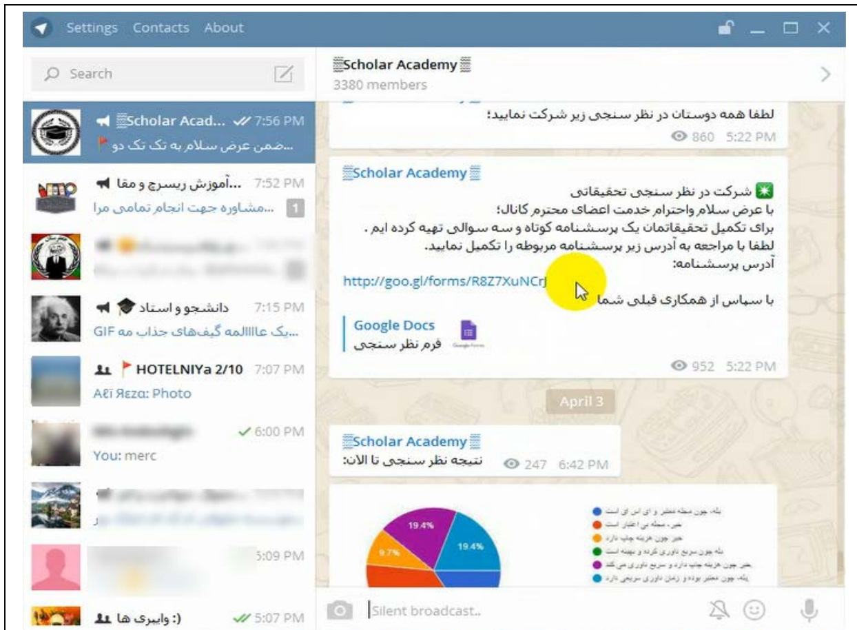
شکل ۱: کانال تلگرام ساخته شده جهت آزمون فرضیه