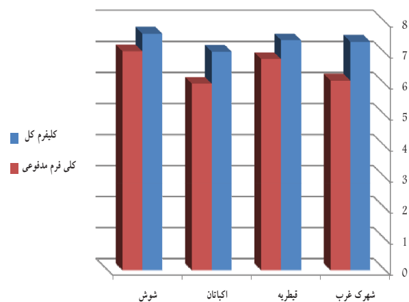
نمودار ۲- لگاریتم میانگین باکتریهای کلی فرم در لجن های تر دفعی از تصفیه خانه های طرح (MPN/g. TS)

کیفیت میکروبی لجن خروجی از تصفیه خانه های فاضلاب نتایج آزمایشات میکروبی لجن خروجی از تصفیه خانه های فاضلاب مورد مطالعه در نمودار ۲ ارائه شده است.