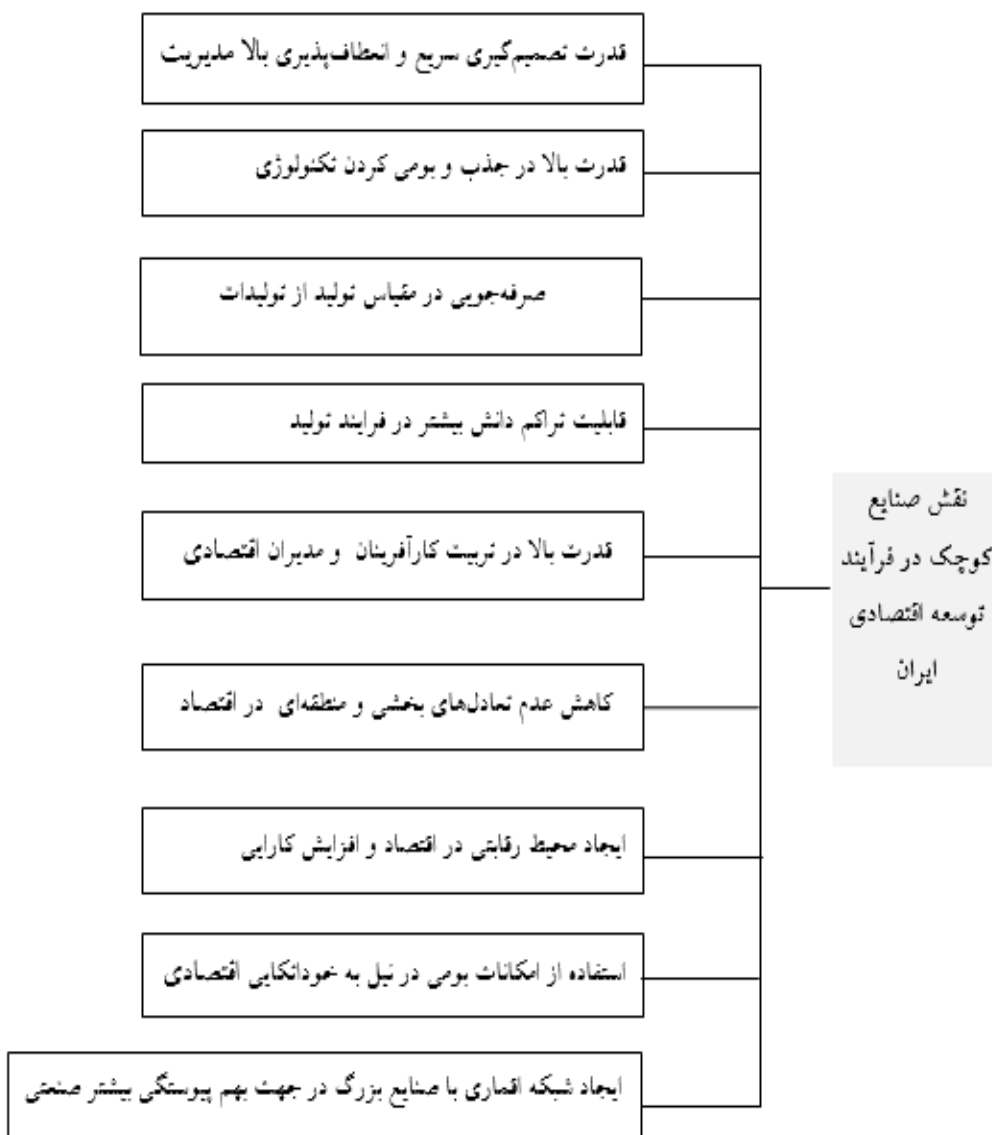
نمودار ۱: نقش صنایع کوچک در فرآیند توسعه اقتصادی