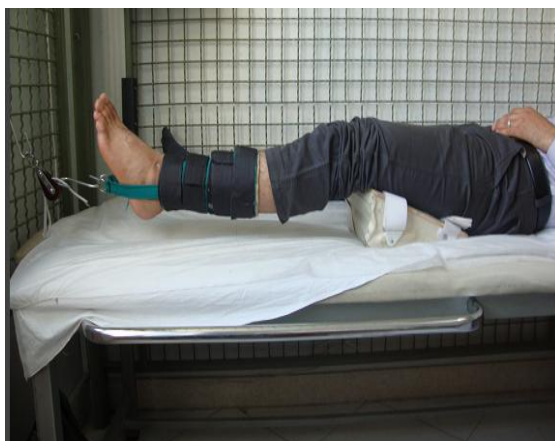
تصویر شماره ۱. روش اعمال کشش مفصلی

در گروه مورد، علاوه بر درمان های بالا در حالت طاقباز با استفاده از یک سطح شیب دار ساخته شده برای این منظور، مفصل زانو در ۳۰ درجه فلکشن ثابت شده (زان بیمار بر روی سطح تخته ثابت می گردید) و با استفاده از ساق بند مخصوصی که بدین منظور طراحی شده بود، با استفاده از فریم و وزنه، کشش مفصلی اعمال گردید. نحوه انجام کشش مفصلی در تصویر شماره ۱ نشان داده شده است. میزان کشش با توجه به آستانه احساس بیمار یعنی کمترین میزان وزنه ای که بیمار احساس کشش مفصلی و سبک شدن زانو را میکرد تعیین گردید.